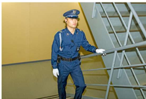
建物内巡回イメージ

鍛え抜かれたガードマンによる五感を使った警備に加え、警備機器を合体させた多角的警備を行うことで、事故や事件の未然防止、早期発見に努めます。