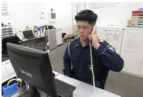
監視センターイメージ

建物内に設置したカメラやセンサーを用いて、防犯、防汚漬、画像監視、出入管理を含め、監視センターによる一元管理を行い、異常時には緊急対応を致します。